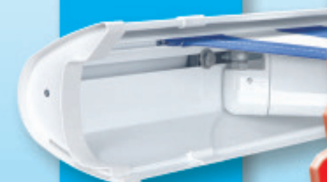
Fallstange mit Kunststoffgleitern und integrierter Regenrinne