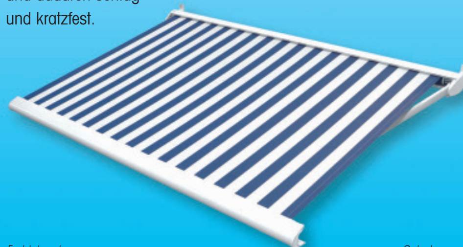
Feststehendes Armlager aus Aluminium

Sämtliche Beschlagteile der Markisen sind aus Aluminium. Die Oberflächen sind pulverbeschichtet und dadurch schlag- und kratzfest.