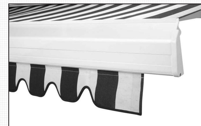
abnehmbarer Volant als Option